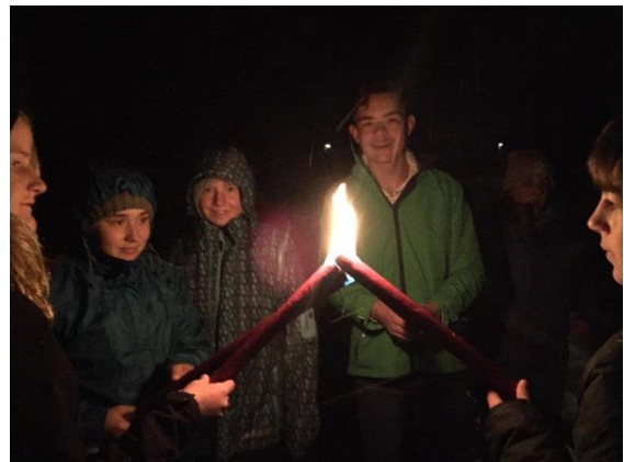
Prägende Momente stärken Freundschaften

Rückblickend freuen wir uns darüber, dass die Angebote des Jugendwerks auch im vergangenen Jahr bei den jungen Menschen Anklang gefunden haben. Die Jugendarbeit ist jedoch eine Tätigkeit, welche von immer wieder wechselnden Bedürfnissen geprägt ist. Deshalb ist es auch unsere Aufgabe, immer wieder zu prüfen, wie unsere Angebote zeitgemäss und wirkungsstark bleiben. Für das kommende Jahr beschäftigt uns beispielsweise, wie auf die Entwicklungen reagiert werden kann, welche am Abend auf einzelnen Schularealen stattfindet.