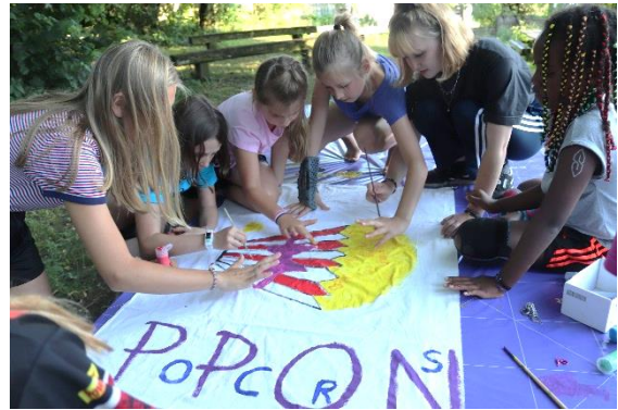
Gemeinsame Herausforderungen wecken die Kreativität

Ein neues Angebot war 2019 der in den Sommerferien durchgeführte Badiplausch im Hirzenfeld . Die Wasserpistolen und das Pull Rodeo sorgten für Dynamik, während Papierblumen falten und Henna – Tattoos als Ausgleich und für ruhige und besinnliche Momente sorgte.