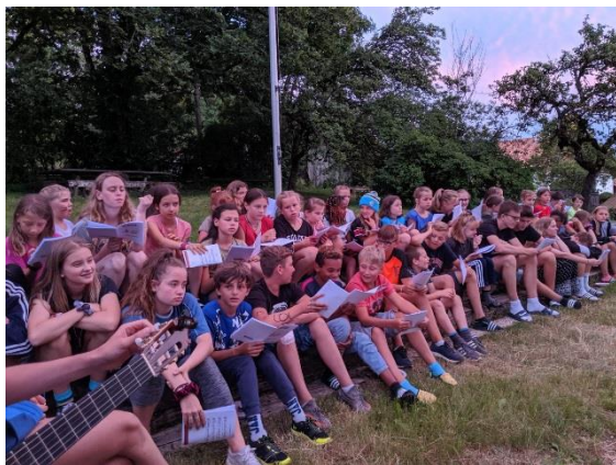
Gemeinschaft ist ein wichtiger Teil unserer Arbeit