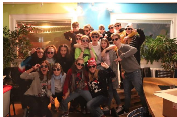
Ein wichtiger Faktor für gelungene Anlässe sind die jugendlichen Freiwilligen

Unser Anliegen, immer wieder aufs Neue bei den angebotenen Anlässen prägende Momente entstehen zu lassen, fordert uns bei der Oberstufe am meisten. Einerseits soll Raum sein für gemeinsamen Austausch und die Pflege von Freundschaften, andererseits sind die Jugendlichen auf der Suche nach starken Erlebnissen und dem Kennenlernen ihrer Grenzen. Auch das Einfordern von Respekt, Wertschätzung und Anstand gehört zu unserer Arbeit. Deshalb freuen wir uns, ist es einmal mehr gelungen, den Jugendtreff als wichtigen Ausgangsort am Freitagabend zu etablieren. Regelmässig fanden am Freitagabend zwischen fünfzig und neunzig junge Menschen den Weg ins Jugendwerk. Bei Angeboten wie Rollschuhdisco, Gladiatoren-Arena, Break Dance Workshop oder einem Abend mit der Feuerwehr konnten sich die jungen Menschen austoben, vieles ausprobieren und neue Erfahrungen sammeln.